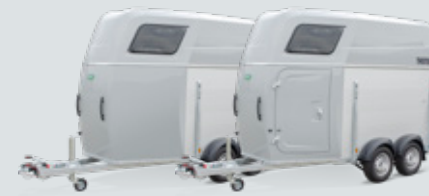
Thensa metallic zilver met of zonder zadelkamer