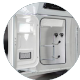
XXL zadelkamer met halsterhouders en zadeldragers