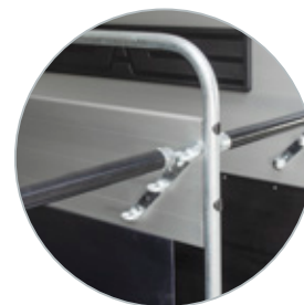
In hoogte verstelbare borst- en bilstangen