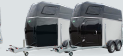
Thensa metallic zwart met of zonder zadelkamer