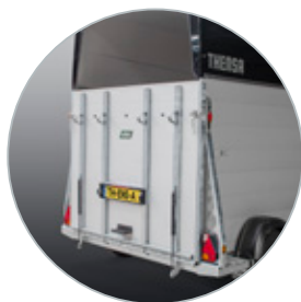
Sterke oploopklep met gasveer ondersteuning