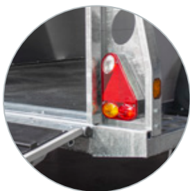
Betrouwbare en duidelijke verlichting