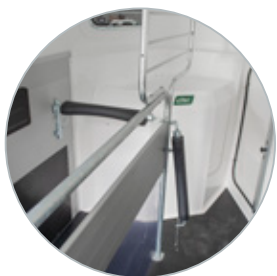
Tussenschot met (optioneel) hengstenrek