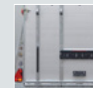
Sterke en veilige achterklep